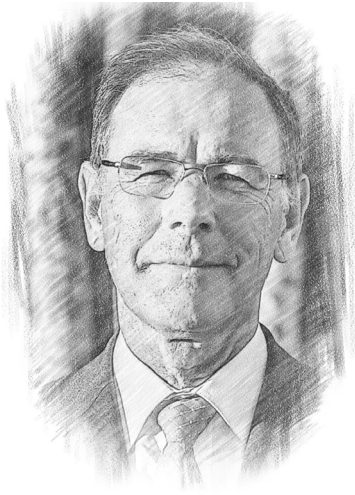
Gérard-François Dumont géographe, économiste et démographe